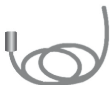
Cable de suspensión

Marco empotrar techo yeso / pladur – Ref. 996807