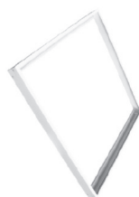
Marco de superficie